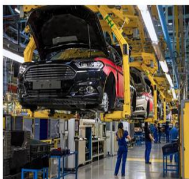
El línea de montaje de Ford Almussafes

Compartir en Facebook | Compartir en Twitter | Compartir en LinkedIn | Compartir en WhatsApp